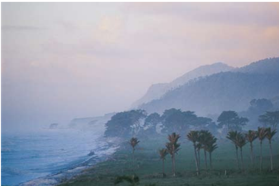
Westküste der Südinsel

11. Tag: Tongariro Nationalpark - Wellington (ca. 310 km). Über Raetihi fahren Sie entlang des Wanganui Rivers. Sie folgen dem Flusslauf auf der alten „Old Post Road“, bis Sie Wanganui erreichen und wieder Asphalt unter den Rädern spüren. Weiterfahrt nach Wellington, wo Sie nachmittags einen Stadtbummel unternehmen können. Ü.