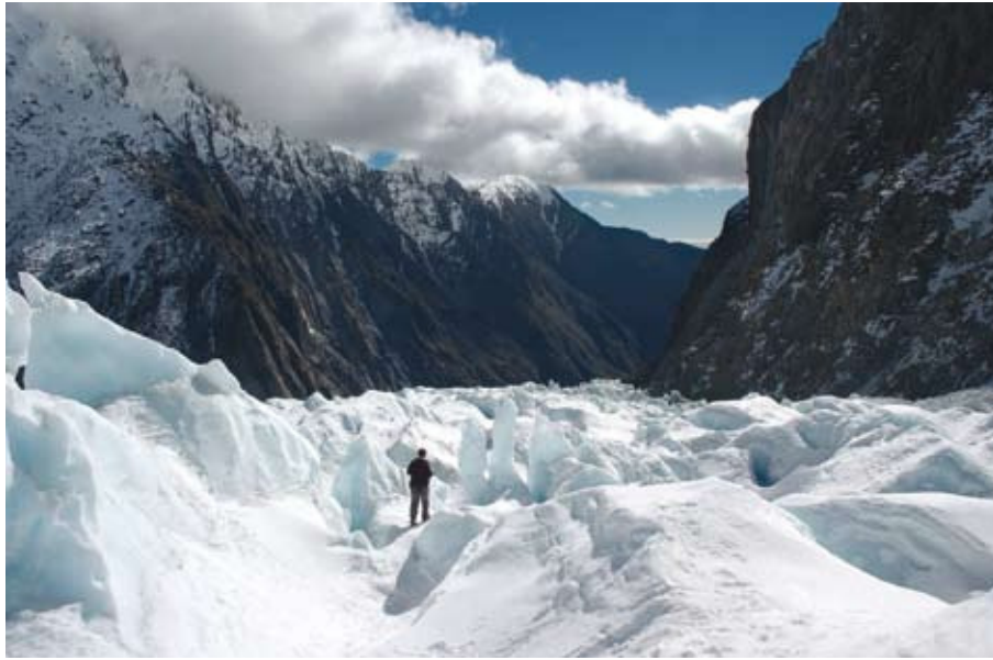
Franz Josef Gletscher