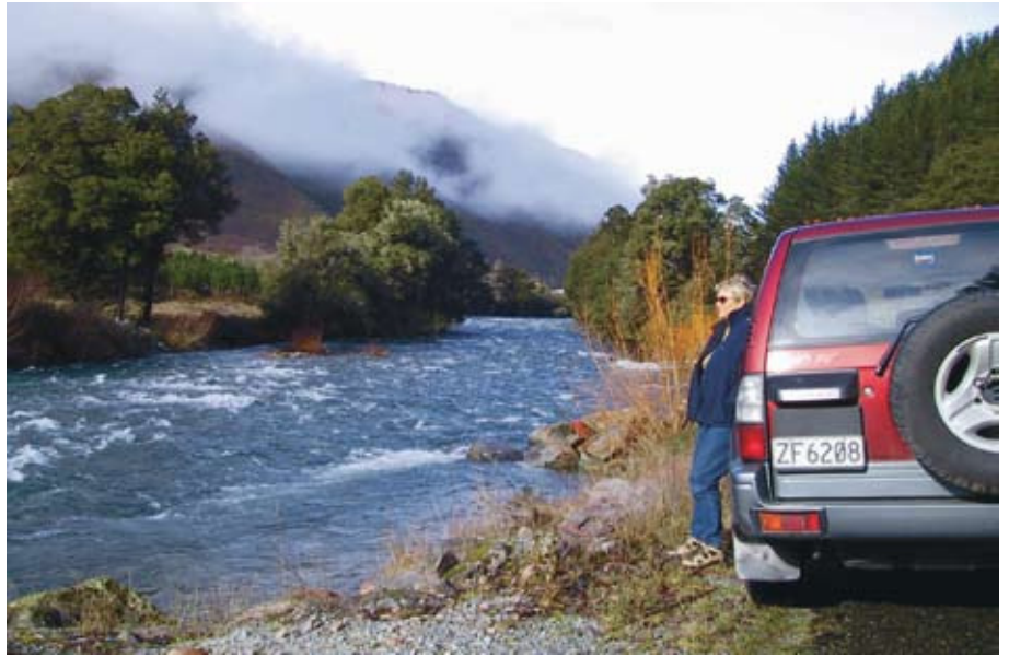
Ruhepause in herrlicher Natur

2. Tag: Auckland - Omapere (ca. 320 km). (22 Tage Tour) Morgens Übernahme des Geländewagens und Fahrt zum Muriwai Beach, bekannt für seine Tölpelko-